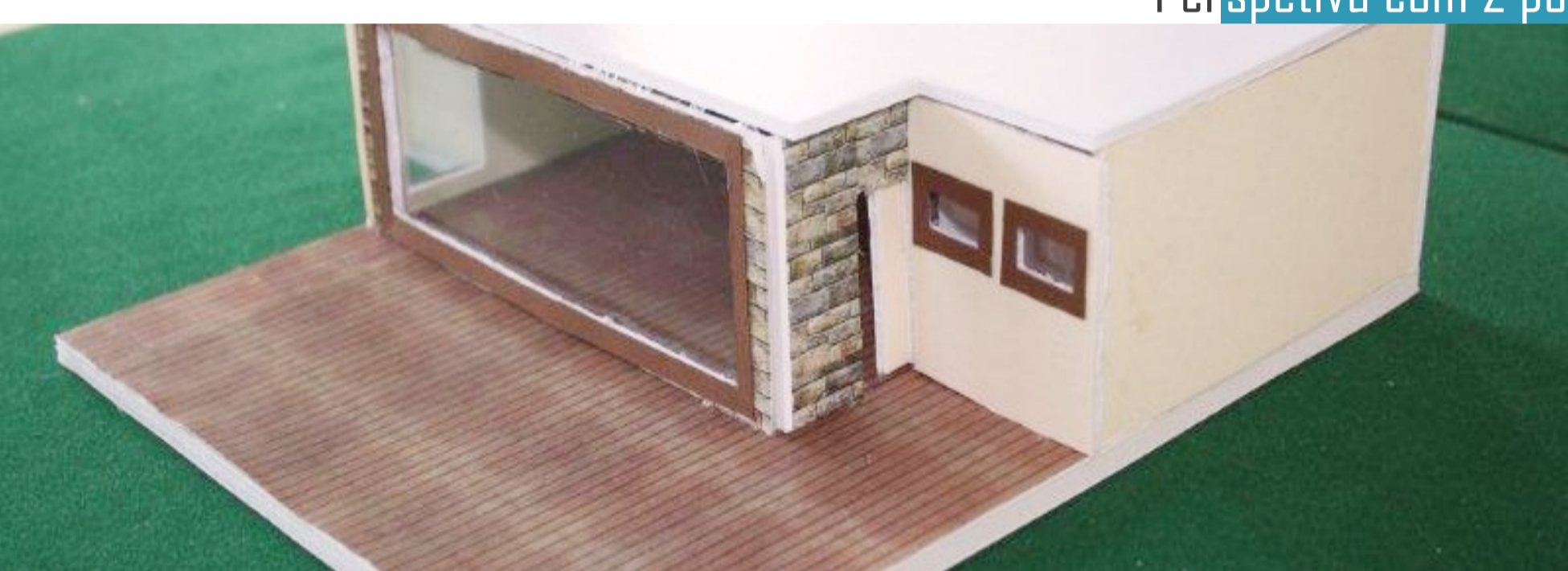
Design de Interiores Archicad