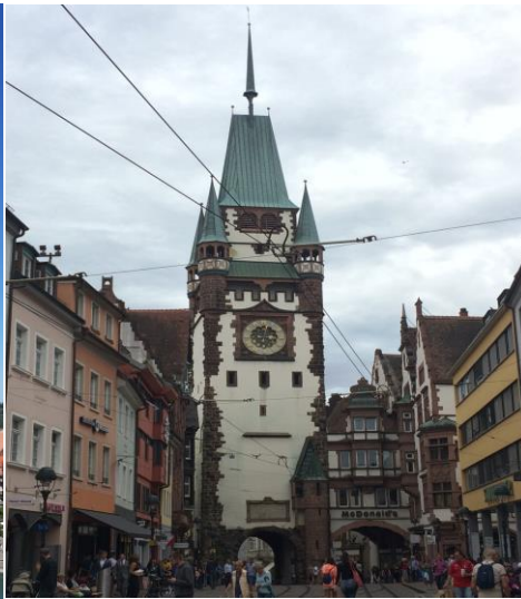
“Goethe Institut” — Freiburg